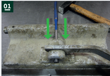
01: Passstift entfernen