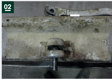
02: Hebel ablegen