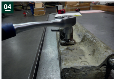
04: Schrauben lösen