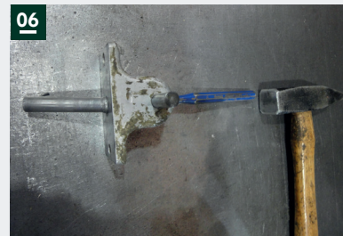
06: Stößel demontieren und austauschen

Anschließend erfolgt die Montage in umgekehrter Reihenfolge.