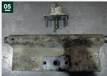
05: Abheberbock entfernen